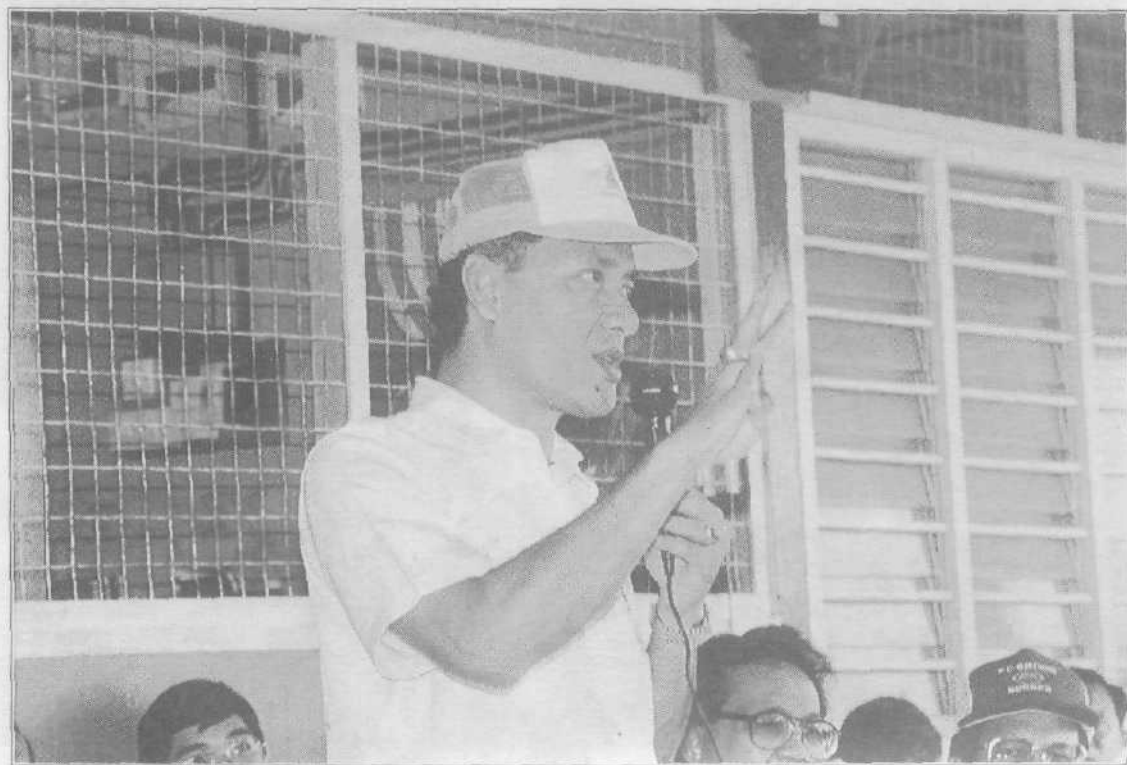
■ Mengingatkan rakyat tentang perjuangan membela nasib bangsa Melayu memerlukan semangat perpaduan , bekerja keras, berdisiplin dan sanggup menerima perubahan.