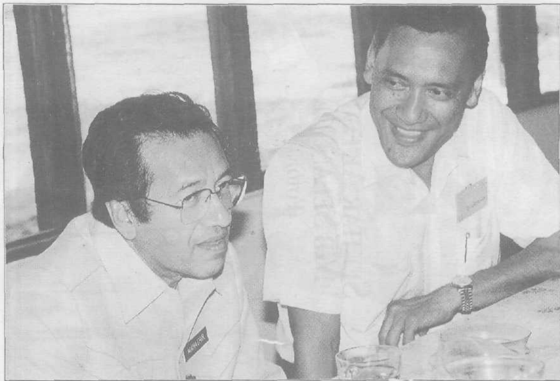
■ Pemimpin yang baik menjadi kebanggaan rakyat jelata. Dr. Mahathir dan Tan Sri Muhammad Haji Muhd Taib dalam satu majlis rasmi di Selangor.