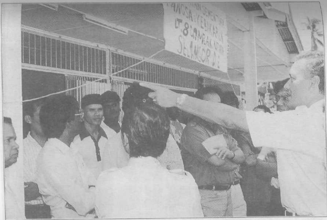
■ Melawat pusat penempatan sementara mangsa kebakaran di Batu 8, Gombak Utara, Selangor.