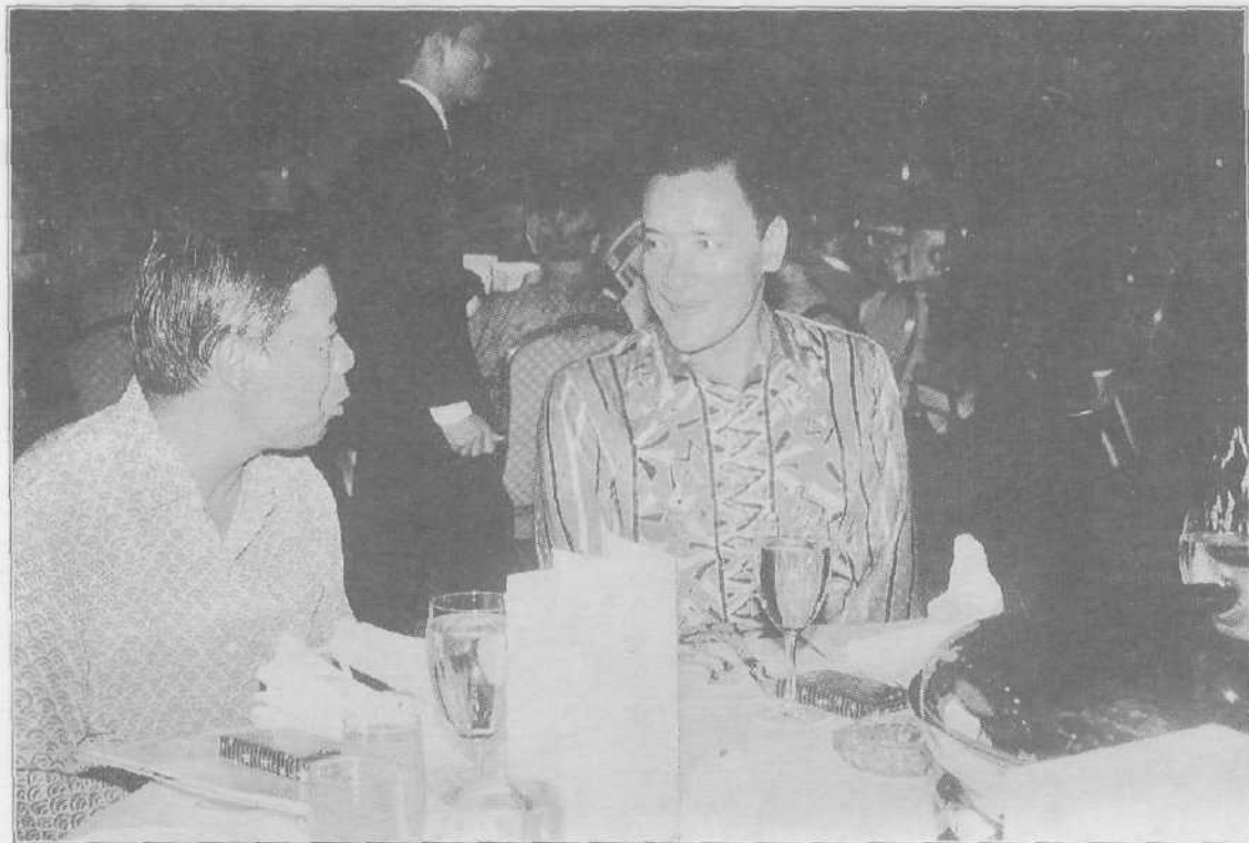
■ Tan Sri Muhammad Haji Muhd Taib sangat mengambil berat hubungan silaturrahim dengan rakan-rakan dalam UMNO.