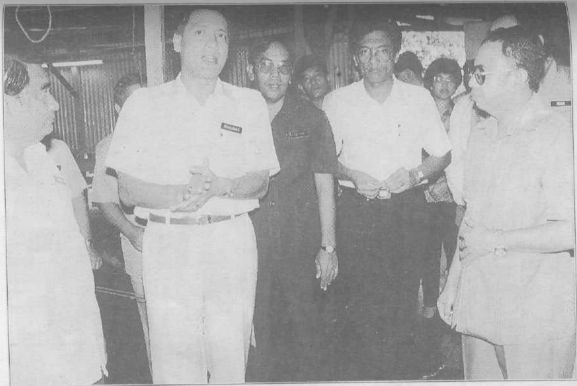
■ Kewibawaan Menteri Besar Selangor sebagai pemimpin masa depan tidak boleh dipertikaikan lagi oleh kawan dan lawan.