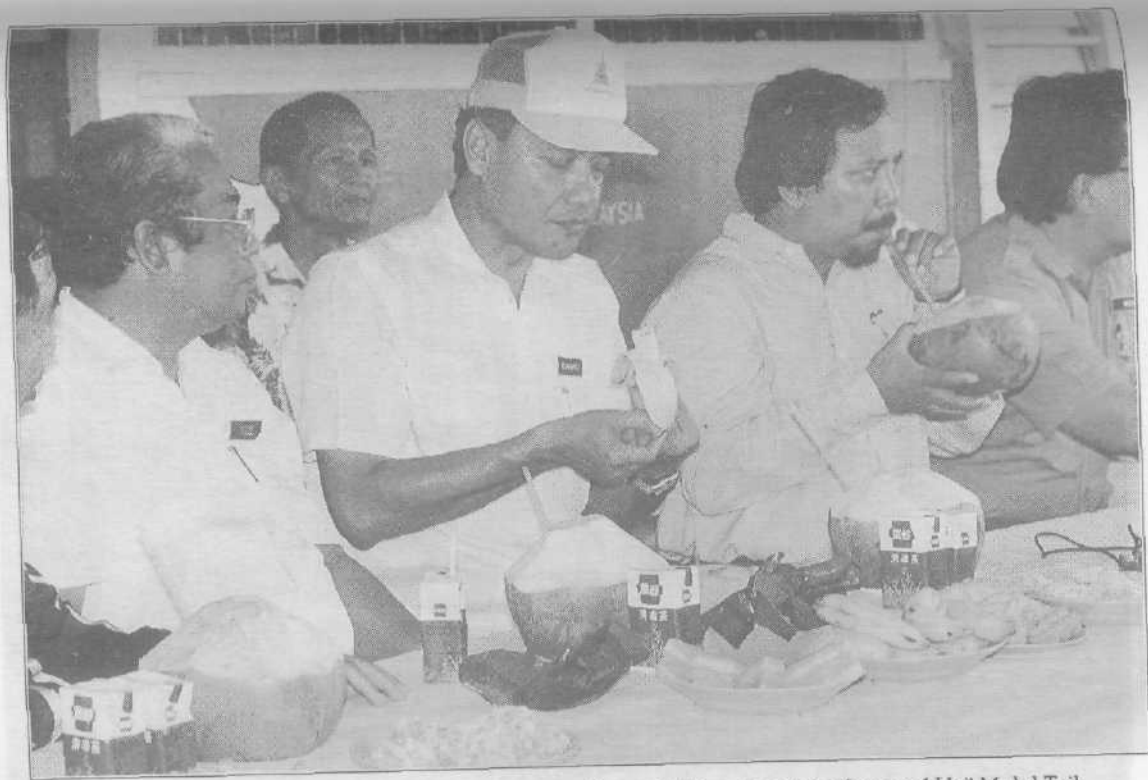
■ "Hmm... lazatnya pisang ni". Mungkin itulah yang terlintas di fikiran Tan Sri Muhammad Haji Muhd Taib.