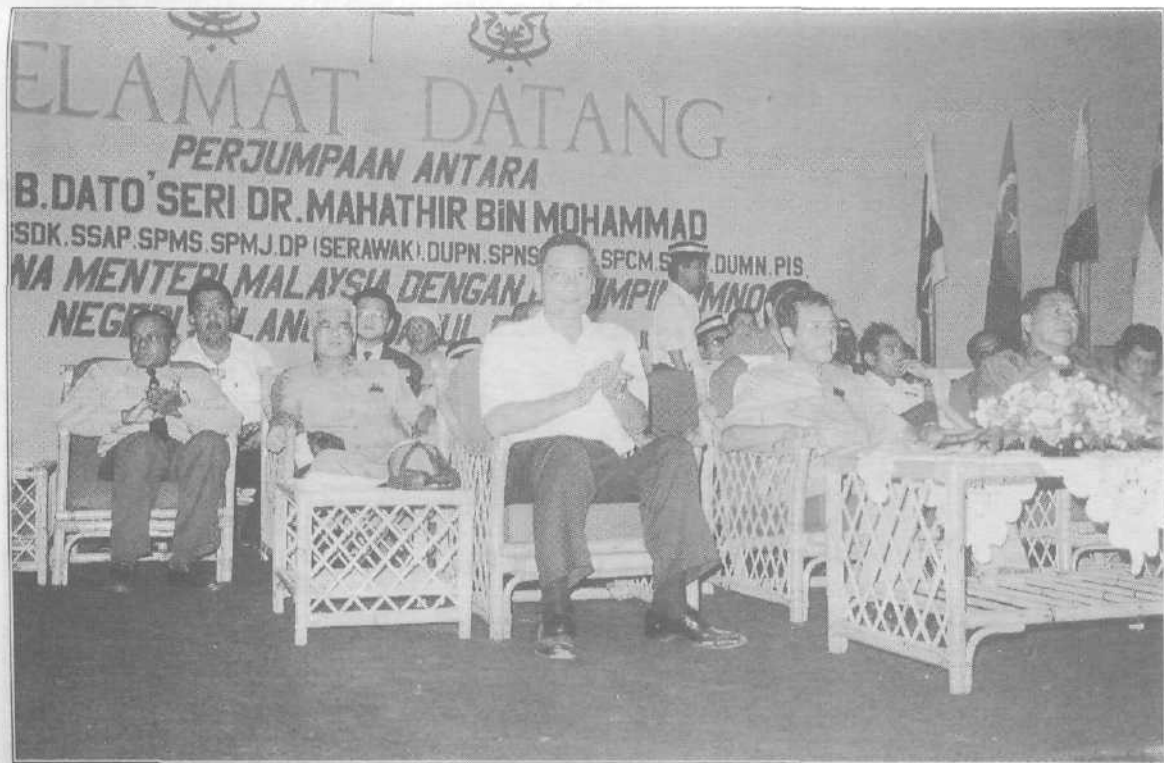
■ Kewibawaan Tan Sri Muhammad Haji Muhd Taib sebagai pemimpin telah terbukti selama menjadi Menteri Besar Selangor dan amatlah wajar dia diberi peluang memegang jawatan politik yang lebih tinggi dalam UMNO.