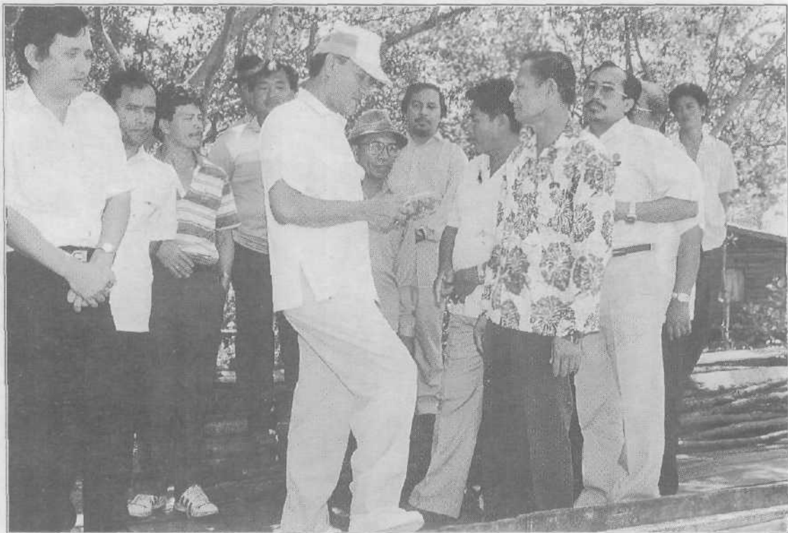
■ Mendengar masalah yang dihadapi oleh rakyat.