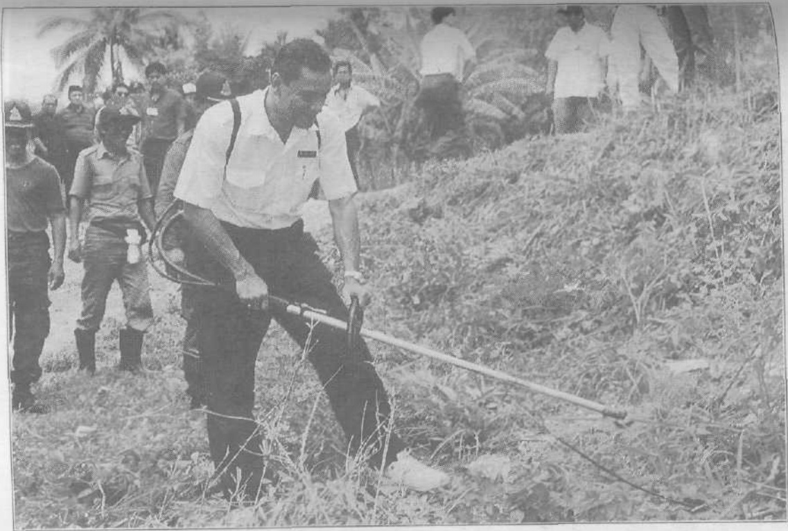
■ Bergotong-royong membersihkan semak samun dalam satu lawatan ke luar bandar.