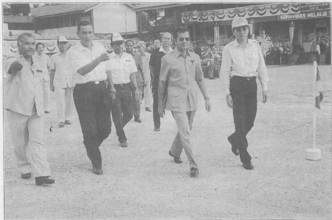
■ Tan Sri Muhammad Haji Muhd Taib merupakan penyokong kuat kepimpinan Dato' Seri Dr. Mahathir Mohamad dan telah merintis pelbagai program pembangunan di Selangor ke arah menjayakan Wawasan 2020.