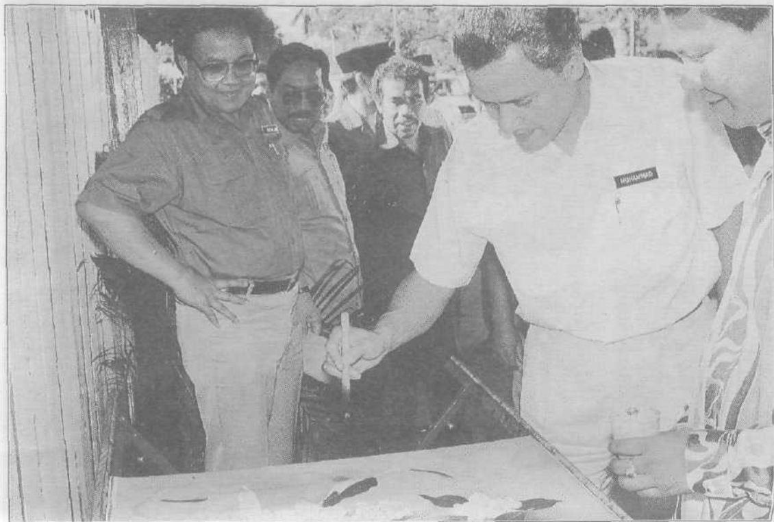
■ Mencoba bakatnya dalam satu pameran batik.