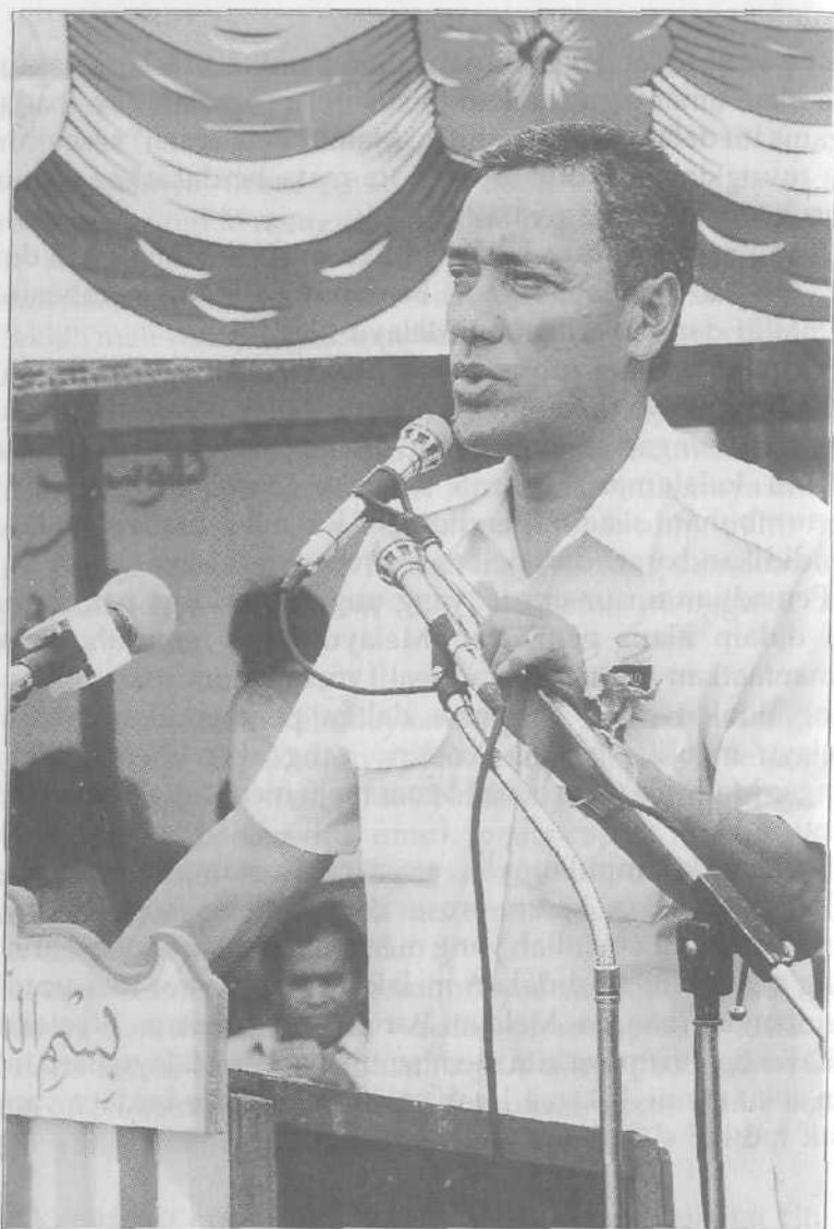
■ Persoalan Melayu Baru kerap disentuh oleh Tan Sri Muhammad Haji Muhd Taib dalam ucapan-ucapan pentingnya termasuk dalam seminar dan forum tentang masa depan bangsa Melayu.