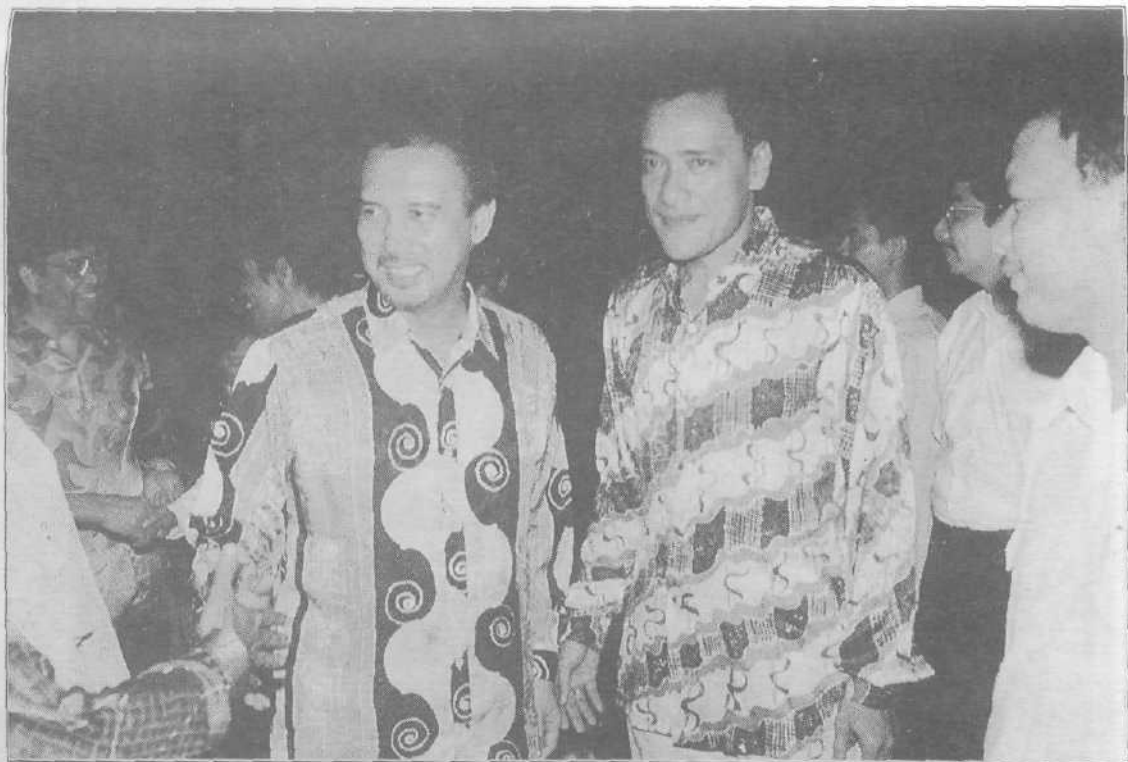
■ Tan Sri Muhammad Haji Muhd Taib bersama rakan karibnya Tan Sri Abd. Rahim Tamby Chik.