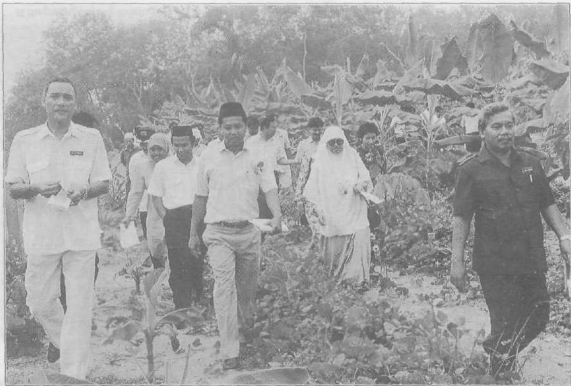
■ Pembangunan di bidang pertanian diberi perhatian serius dalam era kepemimpinan Tan Sri Muhamad Haji Muhd Taib.