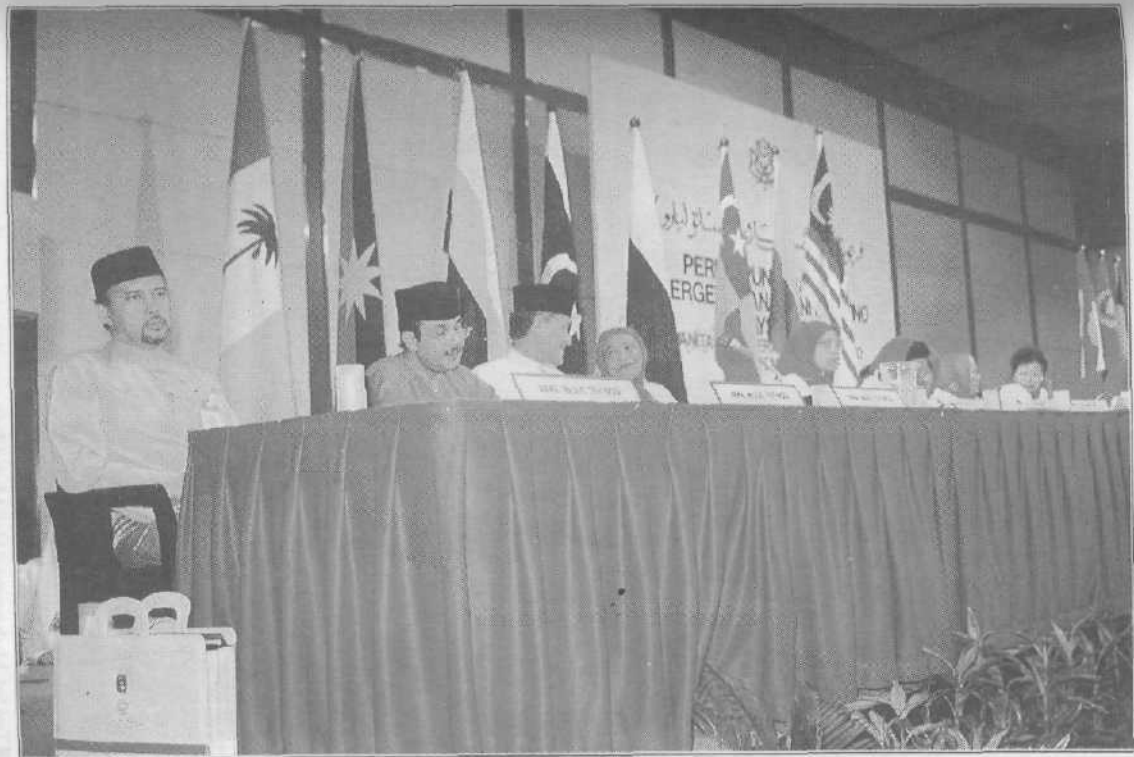
■ Mewakili Majlis Tertinggi UMNO dalam mesyuarat Pergerakan Pemuda UMNO tidak lama dulu.